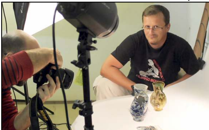
Všetky nálezy z podzemia archeológovia dokumentujú.