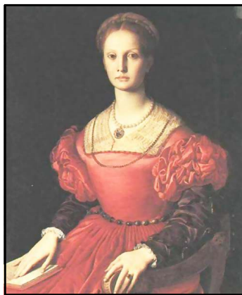
Grófká Alžbeta Báthoryová.