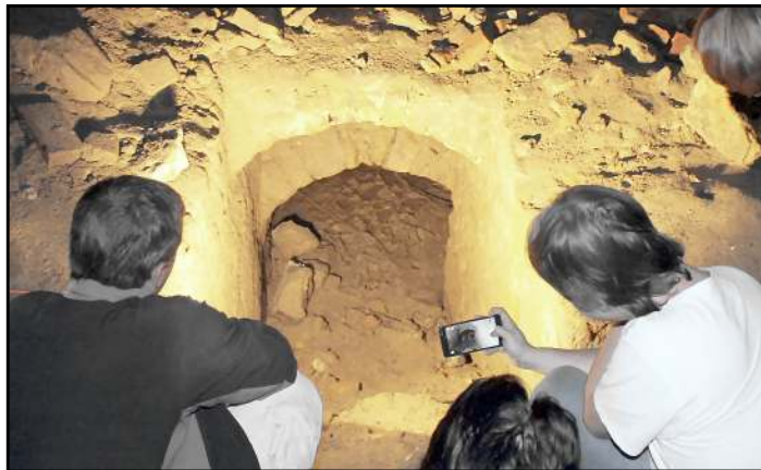
Pod hlavnými hradnými pivničnými priestormi boli o jedno celé podlažie nižšie objavené ďalšie priestory zasypané sutinou.