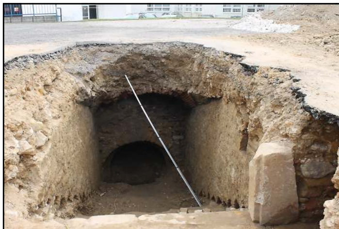
Na školskom dvore bol objavený vchod do hradných pivníc.

V týchto dňoch archeológovia všetky nálezy dôsledne dokumentujú, odhalené sondy zasypú a otvor do pivnice zaistia. Je to len prvá časť výskumu, ktorý sa realizoval vďaka finančnej podpore Prešovského samosprávneho kraja ako vlastníka objektu sumou 30 tisíc eur. Na budúci rok bude archeologický prieskum pokračovať a celkovým zámerom je sprístup-