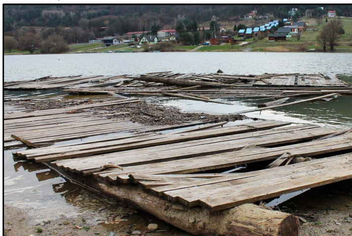
Odpratať z vody je potrebné aj prehnnité a rozpadnuté mólo. (da)