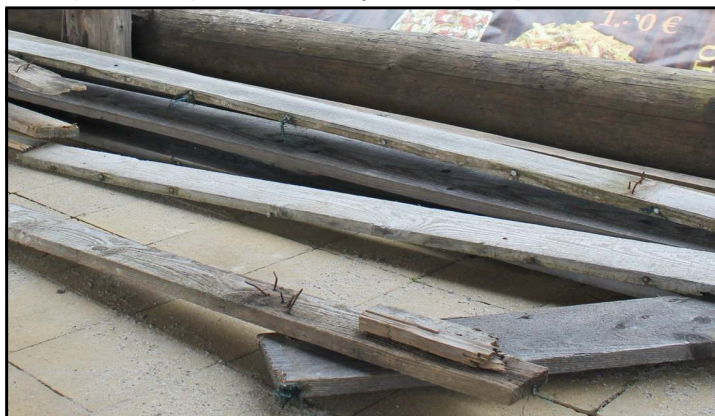
Na hrdzavých klincoch trčiacich z latiek sa môže ktokoľvek zraniť.