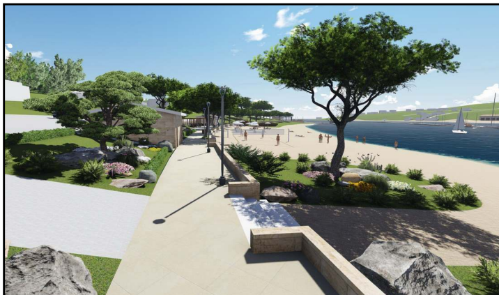
Takto by mohol vyzeráť dnes kritizovaný priestor na Dobrej. Verme, že sa vízie na papieri čoskoro stanú skutočnosťou. (da)