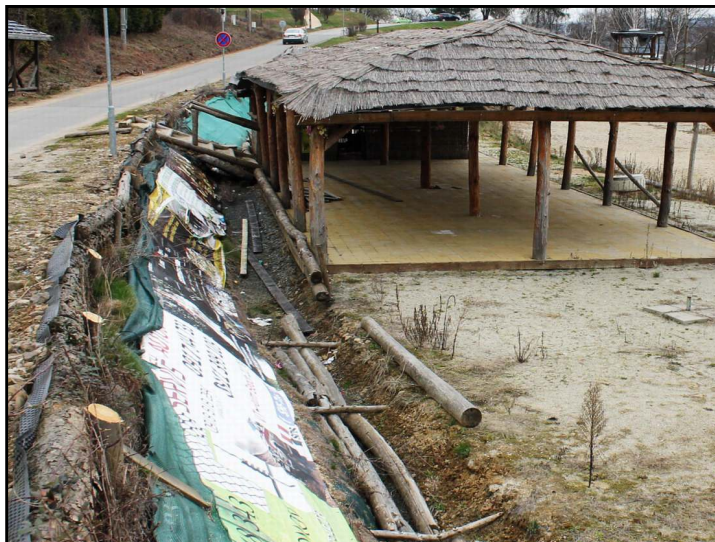
Takéto prostredie potenciálnych návštevníkov Domaše odradí.