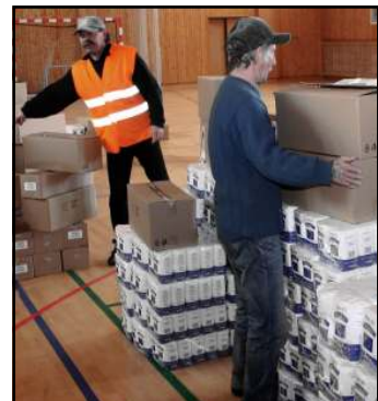
Potravinové balíčky rozdávané sociálne odkázaným sú len slabou náplasťou na chudobu.

Slabú náplasť na zmiernenie chudoby poskytuje aj Európska komisia, ktorá v roku 2014 schválila z Fondu európskej pomoci pre najodkázanejšie osoby ( FEAD ) pre Slovensko v rokoch 2015 až 2020 sumu 55 miliónov eur. Ďalších približne 10 miliónov eur na zabezpečenie jedla a základnej materiálnej pomoci poskytne Slovenská republika z vlastného rozpočtu a z darov sponzorov. Bezplatné balíčky so základnými potravinami ( Pokračovanie na 5. strane )