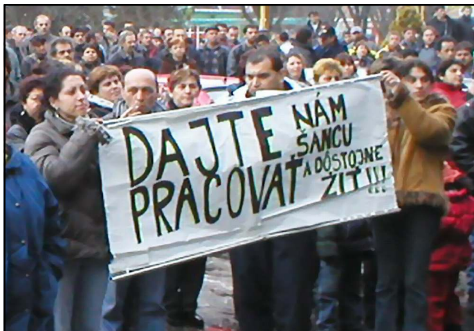
Z protestu Rómov pred budovou Okresného úradu vo Vranove.