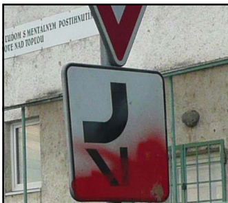
pracovníkmi oddelenia bytov a nebytových priestorov sú vykonávané aj kontroly za účelom

zistenia neprihlásených osôb, ako aj riešenie neporiadku a znečisťovanie okolia odpadom. Hliadky nemôžu kontrolovať len túto ulicu. V meste sú aj ďalšie problémové lokality ako napríklad Rodinná oblasť, Cimatorínska ulica v časti Čemerné, Juh a Lúčna, kde taktiež často dochádza k porušovaniu verejného poriadku. Aj napriek týmto opatreniam je problémom udržať poriadok v okolí bytovky 24 hodín denne. Vzťahy medzi jednotlivými obyvateľmi bytovky nie sú dobré a niektorí neprispôsobiví občania tento neporiadok robia naschvál. Mesto tento problém rieši v rámci svojich možností, právomocí a legislatívy. Situáciu ohľadom dopravných značiek mesto preverí a v prípade potreby zosúladí a osadí značky tak, aby korešpondovali s platnou legislatívou. (js)